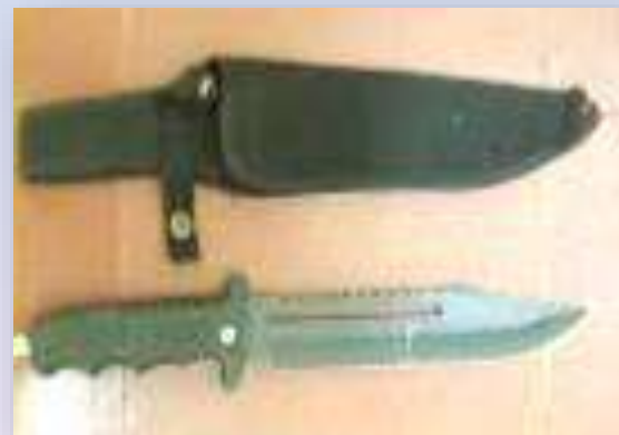
Arma cortopunzante (cuchillo)