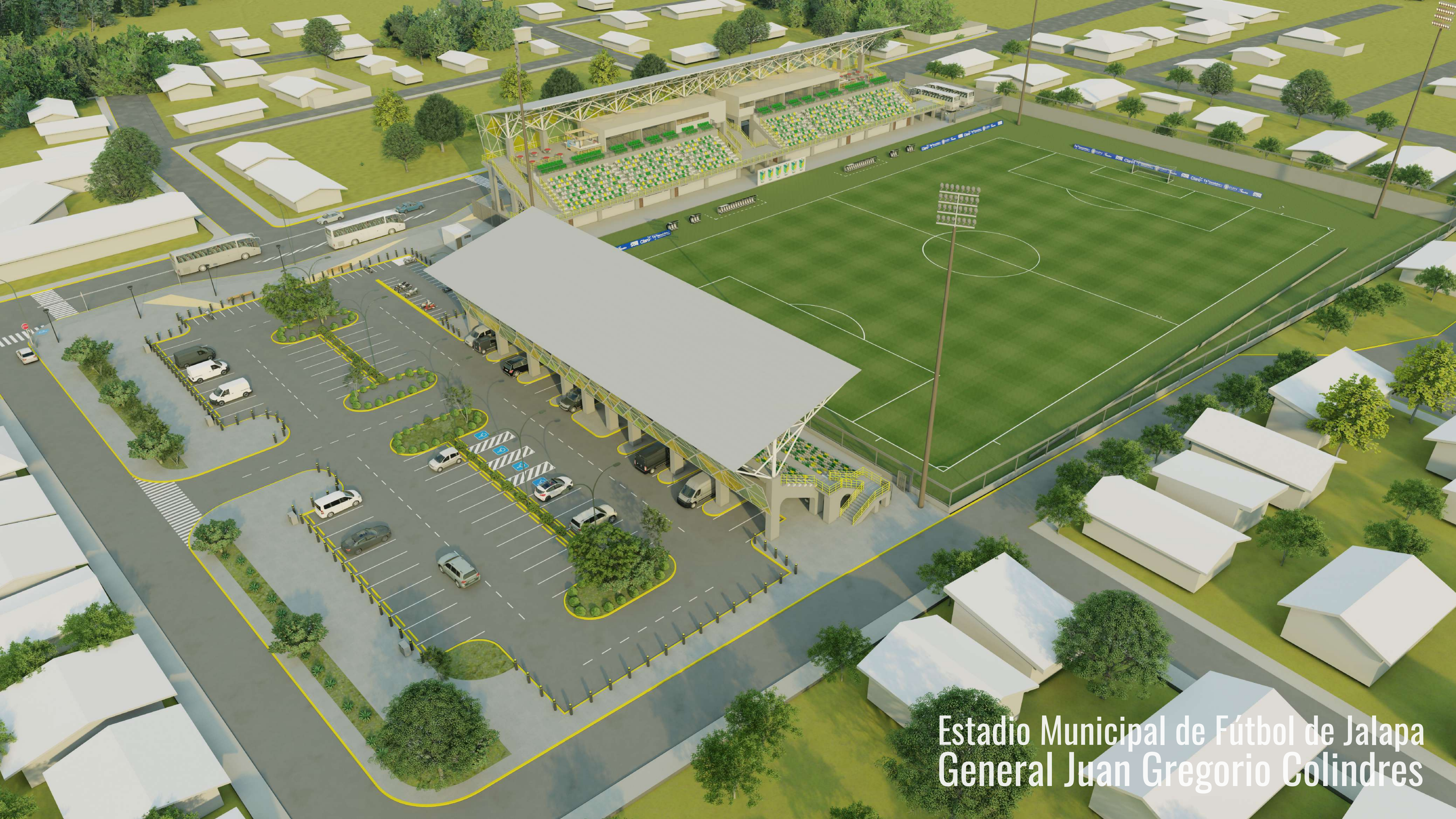
Estadio Municipal de Fútbol de Jalapa General Juan Gregorio Colindres