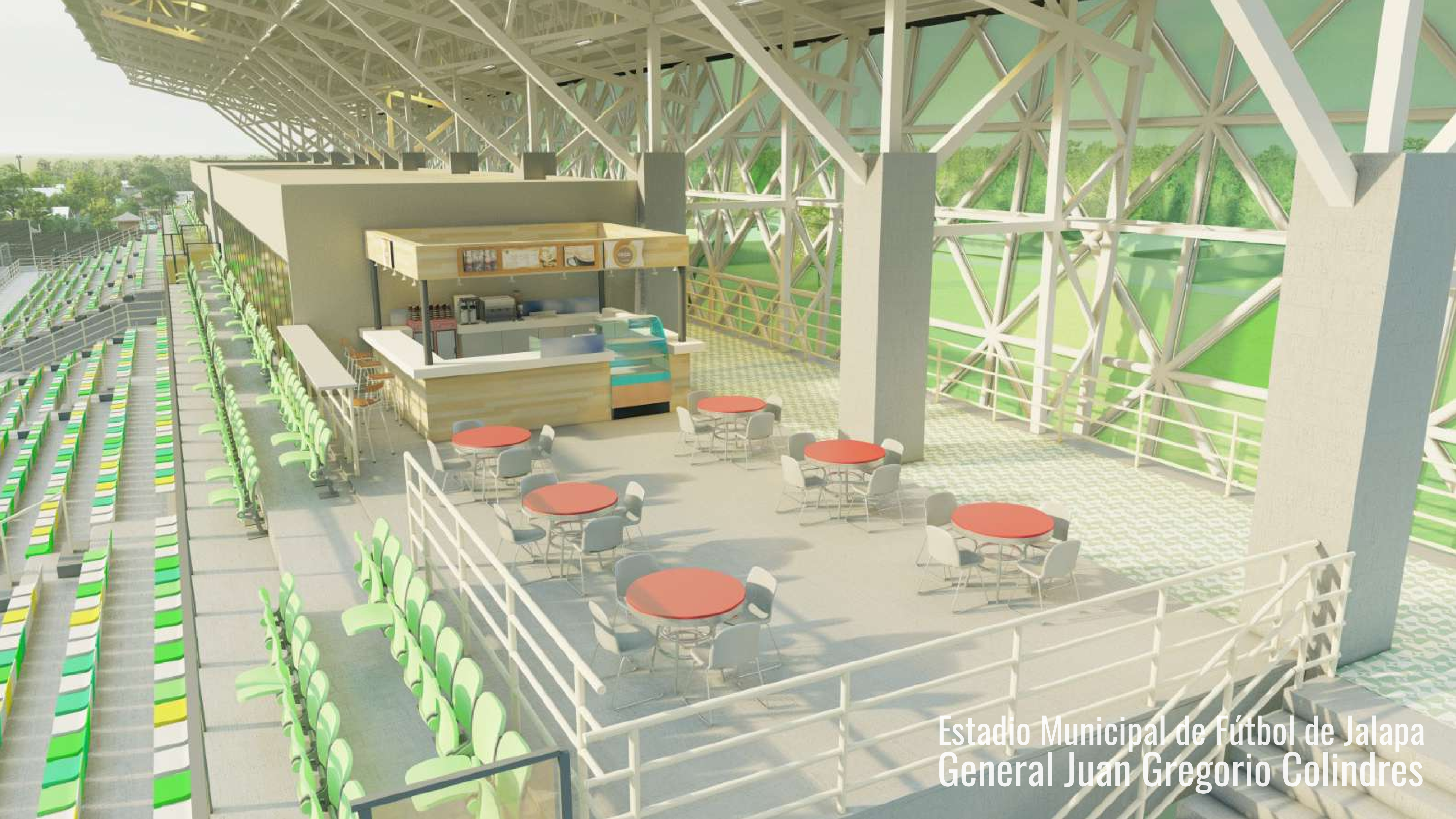
Estadio Municipal de Fútbol de Jalapa General Juan Gregorio Colindres