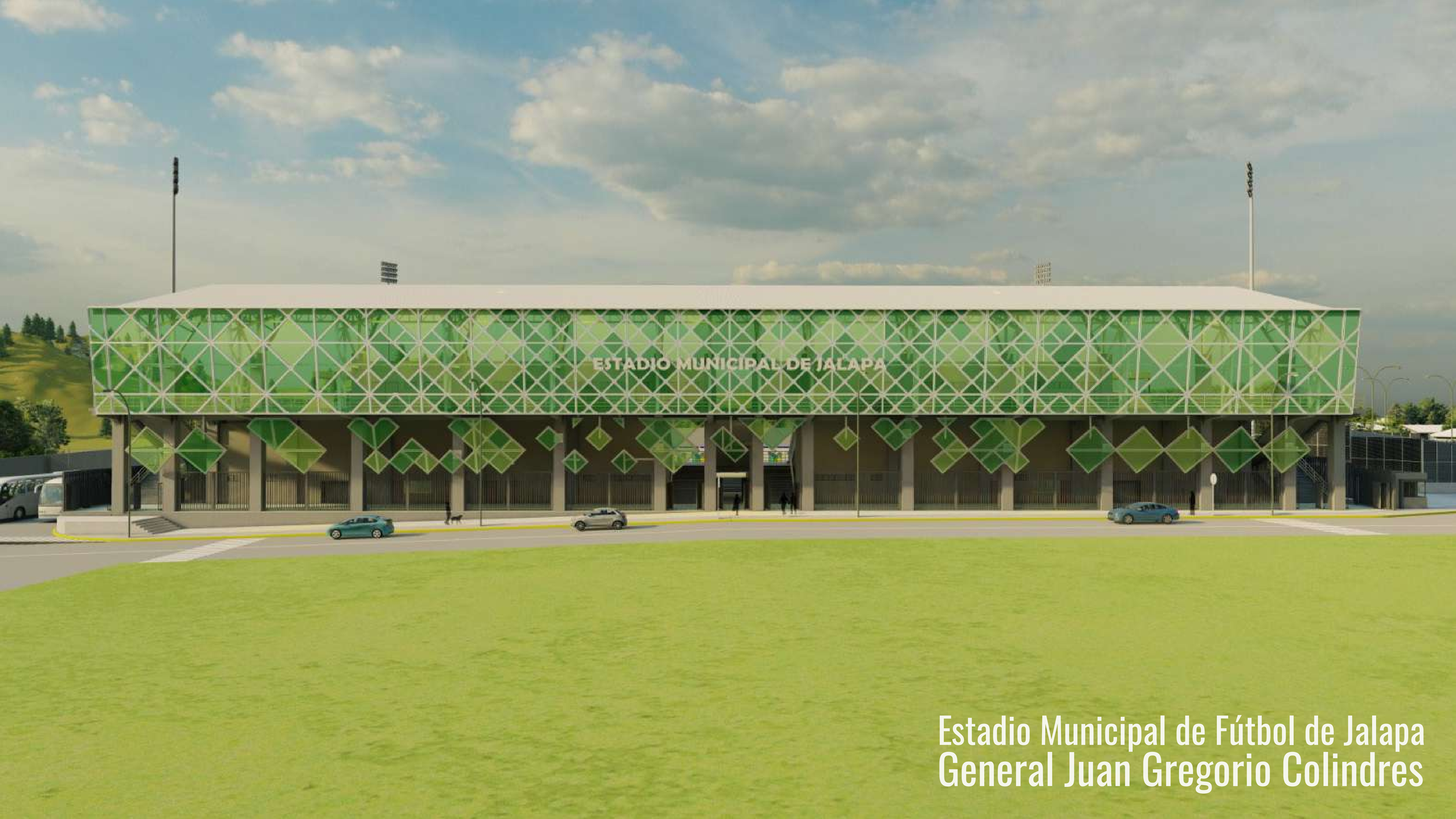
Estadio Municipal de Fútbol de Jalapa General Juan Gregorio Colindres