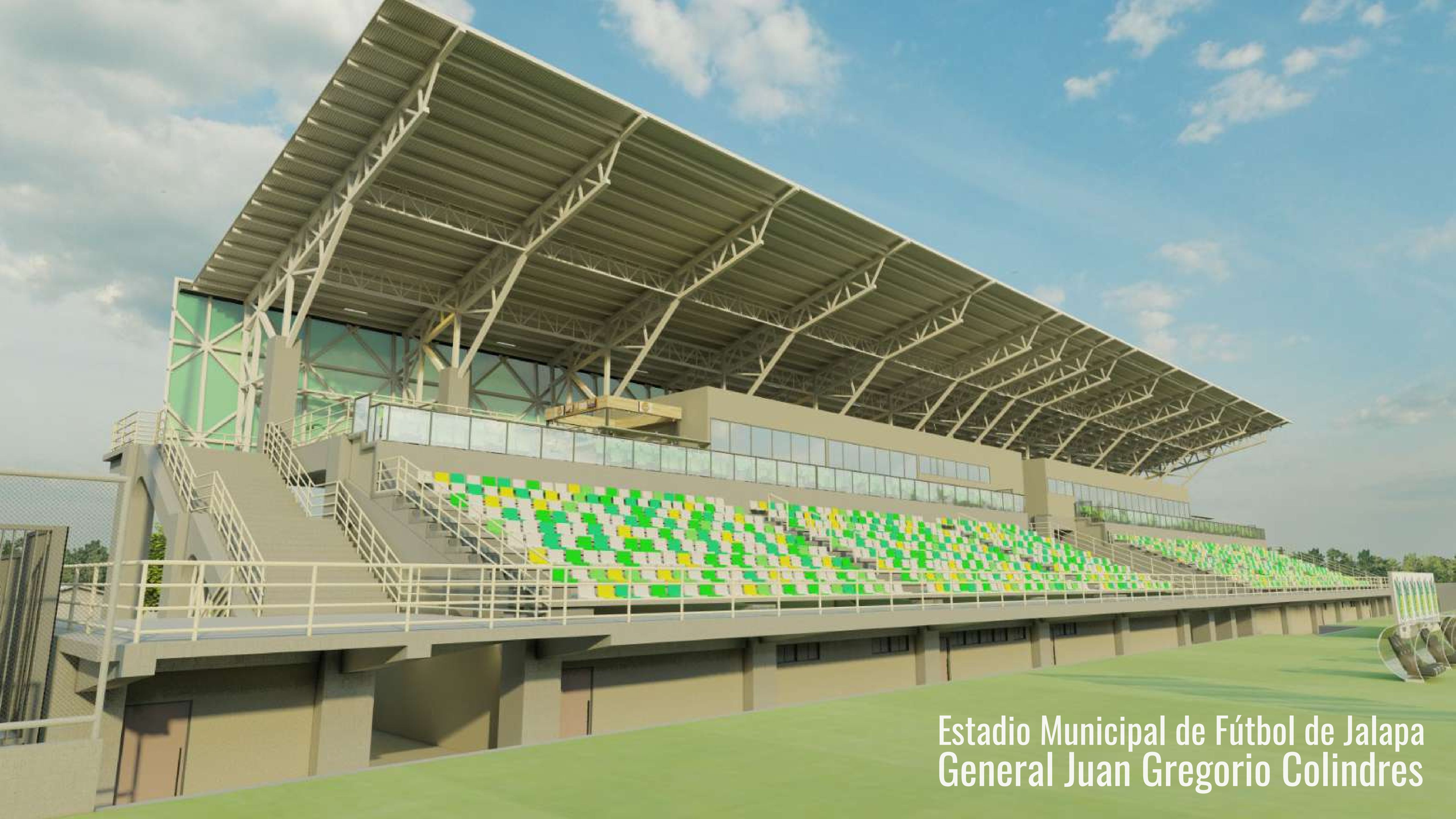
Estadio Municipal de Fútbol de Jalapa General Juan Gregorio Colindres