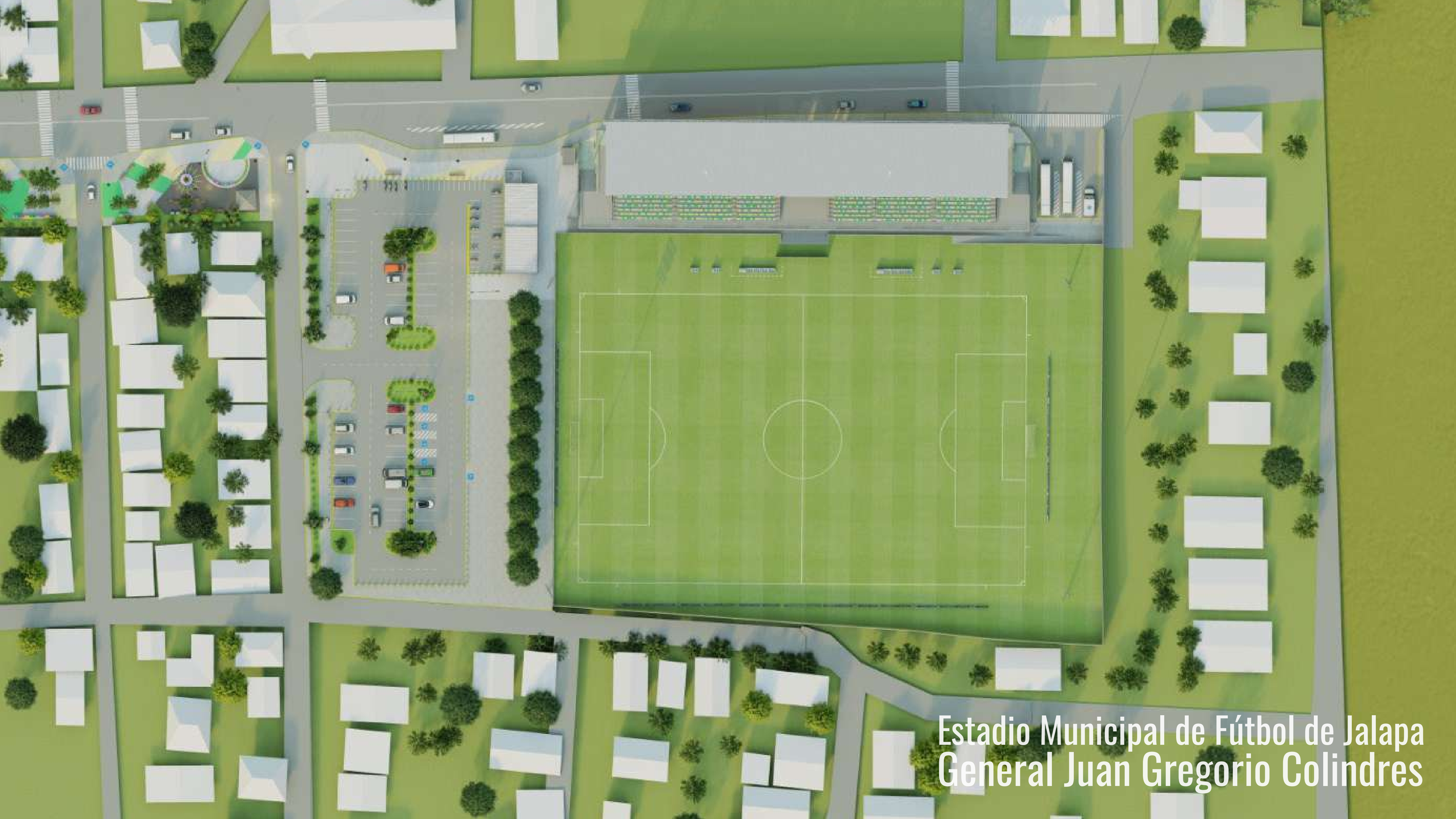
Estadio Municipal de Fútbol de Jalapa General Juan Gregorio Colindres