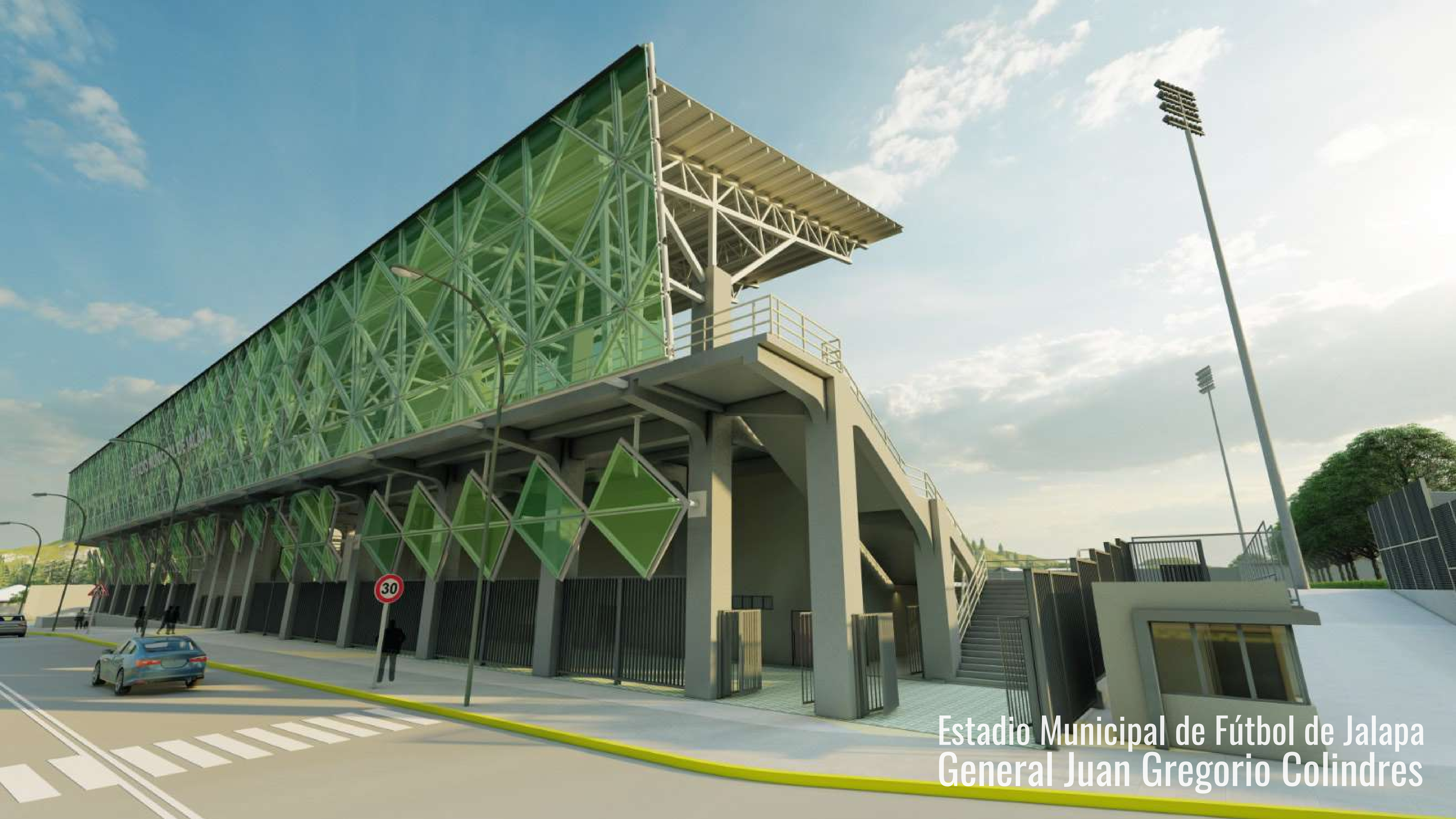
Estadio Municipal de Fútbol de Jalapa General Juan Gregorio Colindres