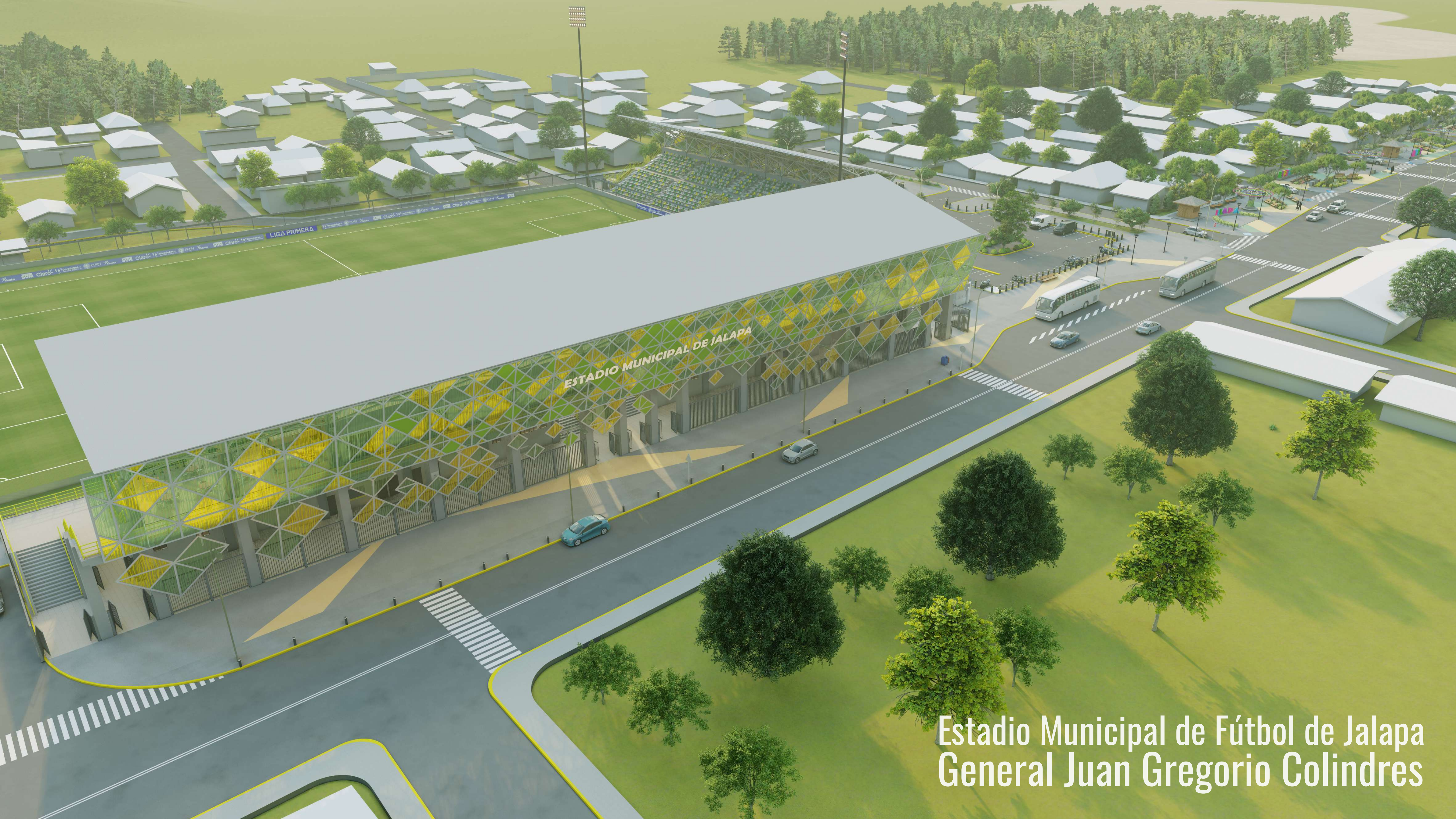
Estadio Municipal de Fútbol de Jalapa General Juan Gregorio Colindres